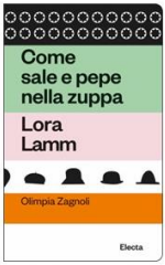
Lora Lamm, Come sale e pepe nella zuppa . Lora Lamm 96 pag, 10x16 cm, 12 euro