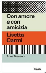
Anna Toscano, Con amore e con amicizia . Lisetta Carmi 96 pag, 10x16 cm, 12 euro