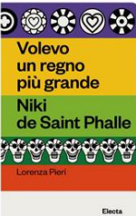
Lorenza Pieri, Volevo un regno più grande . Niki de Saint Phalle 96 pag, 10x16 cm, 12 euro