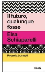
Rossella Locatelli, Il futuro, qualunque fosse . Elsa Schiaparelli 96 pag, 10x16 cm, 12 euro