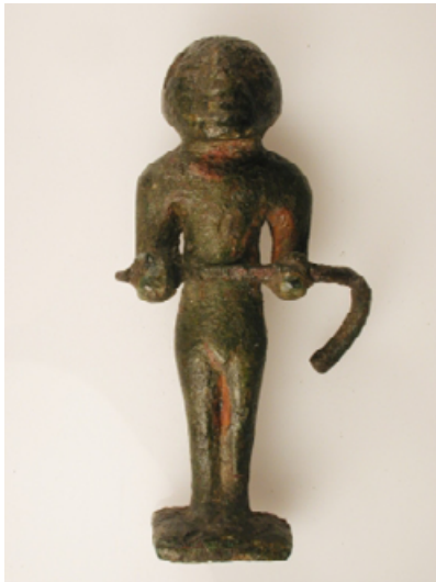
Cosiddetto "Augure del Lapis Niger" (votivo), bronzo, alt. 7,7 cm, prima metà del VI sec. a.C.; dalla stipe votiva del Lapis Niger. Roma, Parco archeologico del Colosseo