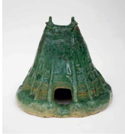
Duilio Cambellotti, Capanna dell'Agro romano, terracotta, alt. 24,5 cm, diam. max 24 cm, 1910–1912 Roma, Archivio dell'Opera di Duilio Cambellotti