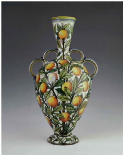
Adolfo De Carolis (attr.), orcio, maiolica, alt. 54 cm, 1900 ca. Collezione Antonello