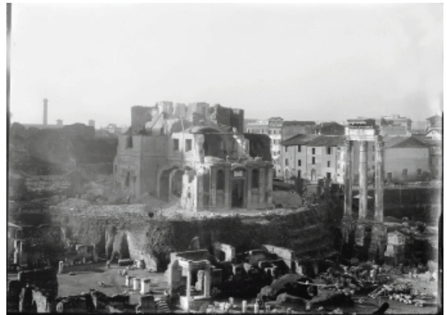
Fase di demolizione di Santa Maria Liberatrice, 1899