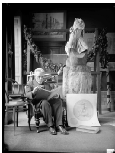
Giacomo Boni nel suo studio presso le Uccelliere Farnesiane, 1923