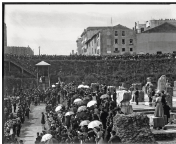
Vicus Tuscus, cerimonia