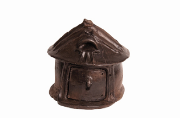
Urna a capanna, impasto, alt. 29,5 cm, largh. max 30,6 cm, fase Laziale IIA (X sec. a.C. ca.); dal Sepolcreto presso il Tempio di Antonino e Faustina, tomba C. Roma, Parco archeologico del Colosseo