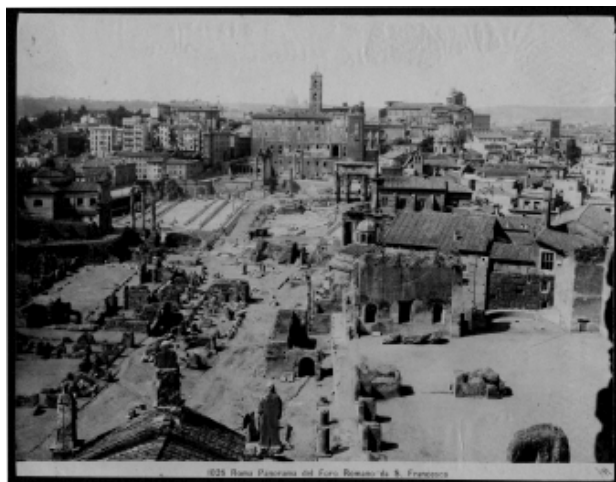
L'area del Foro Romano ripresa dalla chiesa di Santa Francesca Romana, fine del XIX secolo: visibile a sinistra, in alto, la chiesa seicentesca di Santa Maria Liberatrice, che Giacomo Boni fece demolire nel 1900 per poter scoprire l'antica chiesa di Santa Maria Antiqua, nota dalle fonti, invano cercata da Rodolfo Lanciani.