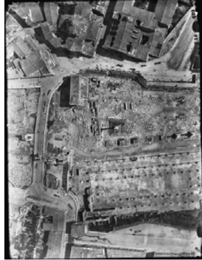
Foro Romano (lato occidentale), veduta dal pallone frenato