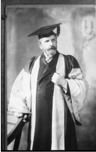
Fotografia di Giacomo Boni nell'assegnazione della laurea all'Università di Oxford, 1907