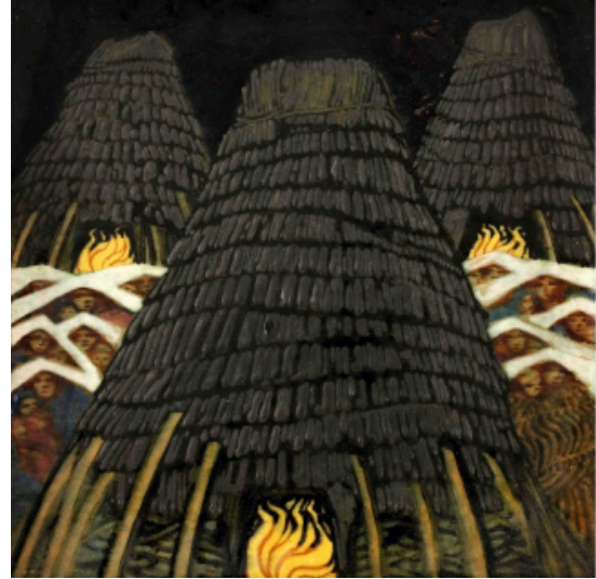
Duilio Cambellotti, Mattonella delle capanne (Villaggio), terracotta dipinta e invetriata, alt. 18,5 cm, largh. 18,5 cm, 1910–1912 Roma, Archivio dell'Opera di Duilio Cambellotti