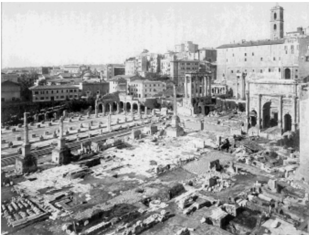
Foro Romano, veduta dal pallone frenato