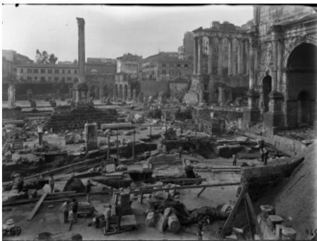
Il Comizio e il Lapis Niger in occasione della scoperta nel 1899